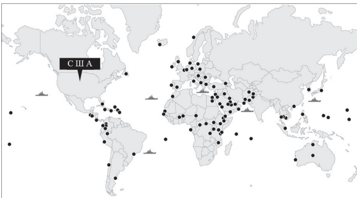
Военные базы США за рубежом

После поражения СССР в холодной войне в мире осталась одна сверхдержава – США. Тогда они построили свою империю – однополярный мир. Америка управляет миром через мировую валюту – доллар. Она устраивает кризисы и цветные революции, вводит санкции, контролирует мировые финансы и торговлю. Для контроля над миром США имеют самую сильную армию и 700 военных баз в 50 странах. В результате Америка благоденствует: они печатают доллары и покупают на них товары со всего мира. Ежегодно они покупают на 600 млрд $ больше, чем продают. Поэтому их государственный долг уже перевалил за 23 трлн $. США живут за счёт остального мира. Если другие страны выйдут из-под их контроля и перестанут покупать доллары, то им придётся в разы сократить потребление. Это приведёт к внутреннему кризису и развалу США.